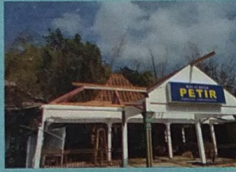
Rehabilitasi Berat Balai Desa