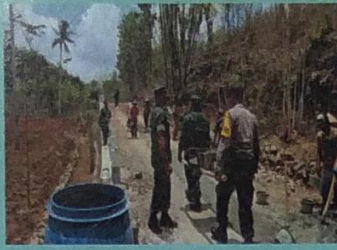
Pembangunan Cor Blok MKB TNI