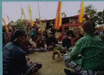
Gelar Potensi Desa