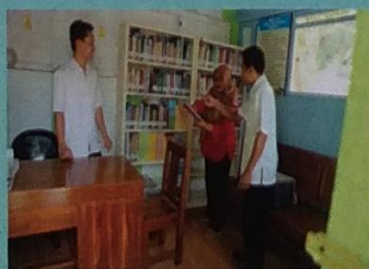
Pengembangan Perpustakaan Desa