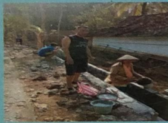
Drainase Siyono C