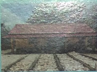
Pembangunan Gedung PAUD Weru