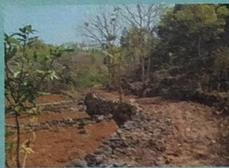
Jalan Usaha Tani