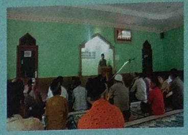
Jum'atan bersama Kapolres GK di Dadapan